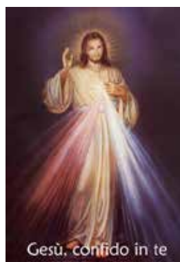
Gesù, confido in te